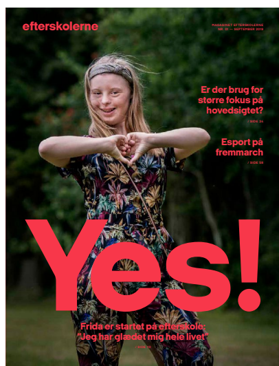
FORSIDEN AF DET FØRSTE MAGASIN

Tilsammen har de nye medier dannet grundlag for foreningens nye visuelle identitet og designguide for alt materiale, herunder nyhedsbreve, publikationer og merchandise.