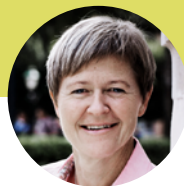
Politikeren og fagforenings- mennesket Josephine Fock Cand.jur. og initiativ- tager til Alternativet