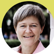
Politikeren og fag- foreningsmennesket Josephine Fock MF, cand.jur. og initiativtager til Alternativet